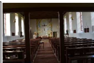
„St. Wendelin“ Ailertchen