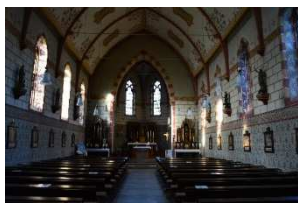
„St. Josef“ Schönberg“